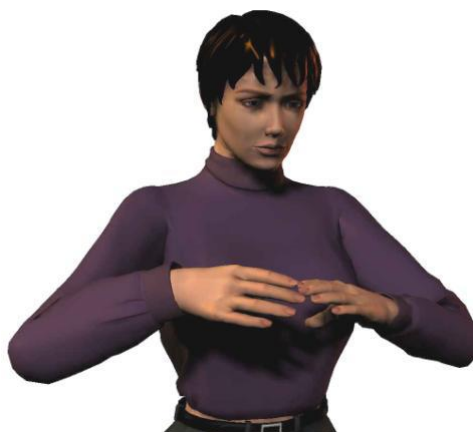
Optimale werkhouding voor knippen: tussen borst en schouderhoogte

De kapper verricht bij het werken aan de pompstoel de vaktechnische handelingen tussen borst en schouderhoogte met de schouders én ellebogen ontspannen laag hangend. Bij uitzondering mag de kapper hoger (tot ooghoogte) knippen.